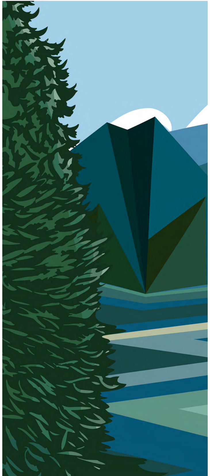
الفنان: Carrielynn Victor