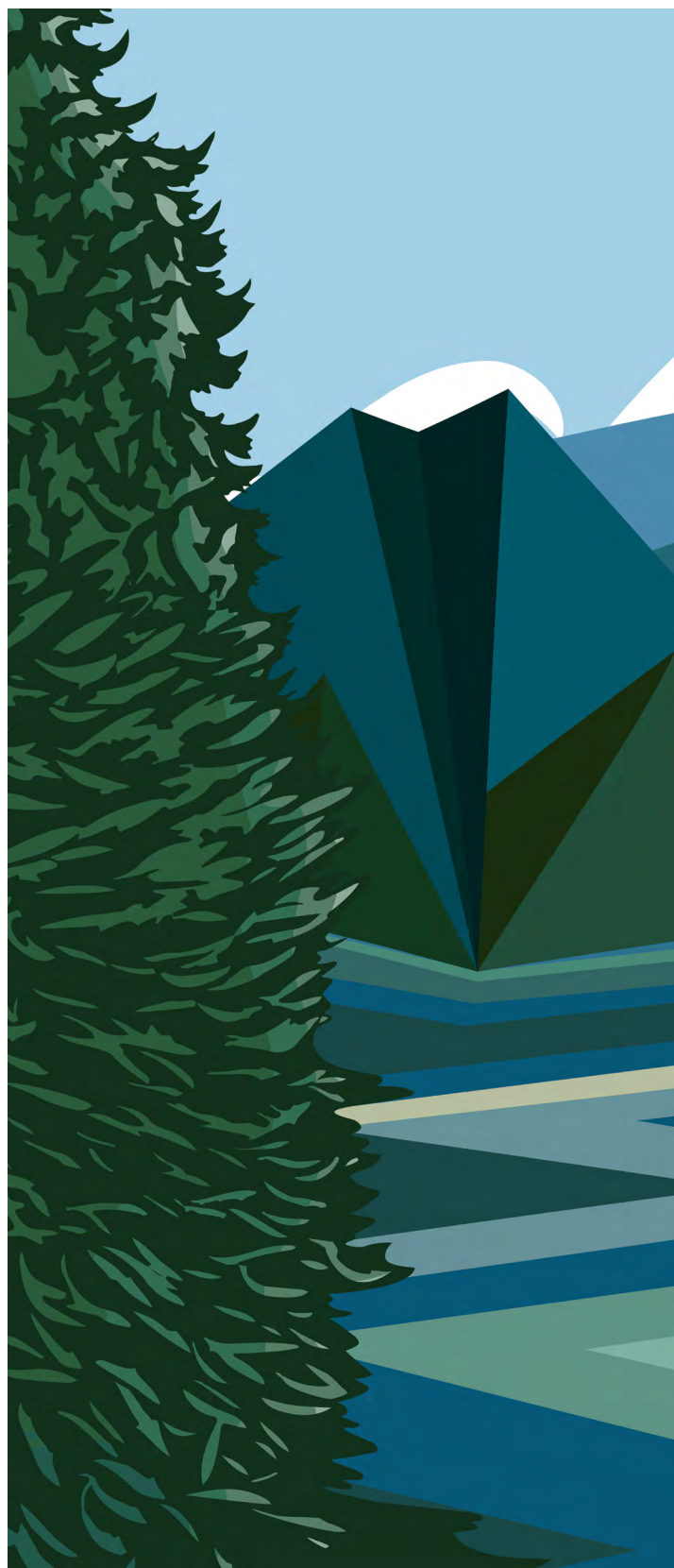
Artista: Carrielynn Victor