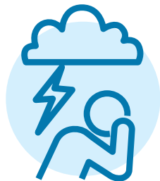
مشکلات سلامت روان مانند تنگ خلقی، اضطراب یا افسردگی