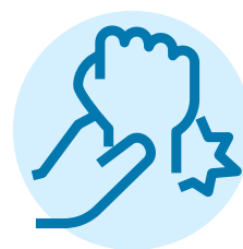
بیخ‌خوردگی و کشیدگی