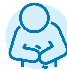
حالت تهوع، اسهال و یبوست