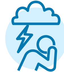
Problemas de salud mental, como desánimo, ansiedad o depresión