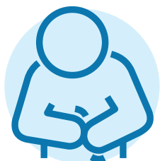
Buồn nôn, tiêu chảy và táo bón