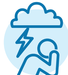
Các vấn đề về sức khỏe tâm thần như tâm trạng chán nản, lo lắng hoặc trầm cảm