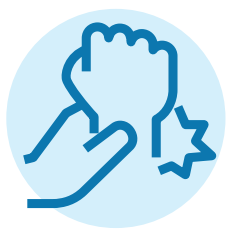
Bong gân và căng cơ

Bác sĩ gia đình hoặc điều dưỡng cao cấp của bạn biết rõ nhất về nhu cầu chăm sóc sức khỏe của bạn, nhưng nếu bạn không thể gặp họ, hãy đến một trung tâm UPCC (Urgent and Primary Care Centre) để được chăm sóc khẩn cấp trong cùng ngày cho các vấn đề sức khỏe không đe dọa đến tính mạng.