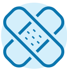
Vết cắt, vết thương hoặc bệnh trạng về da