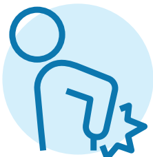
Cơn đau mới hoặc trầm trọng hơn